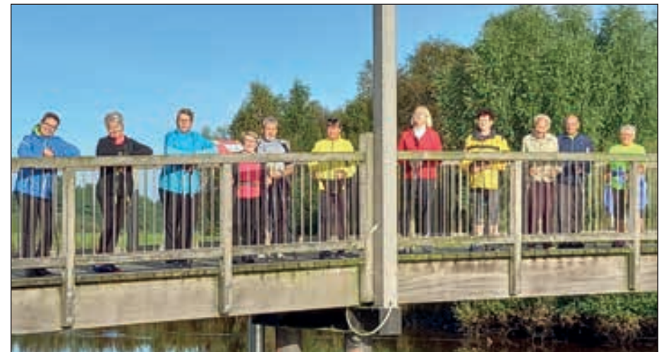
REHA-Sport hält fit bis ins hohe Alter.

Von April bis Oktober jeweils am ersten Mittwoch im Monat.