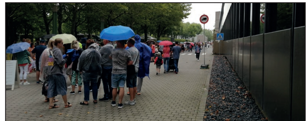
Die Fotografen waren Heinrich Krone, Rosi Niemeyer und Georg Lensing.