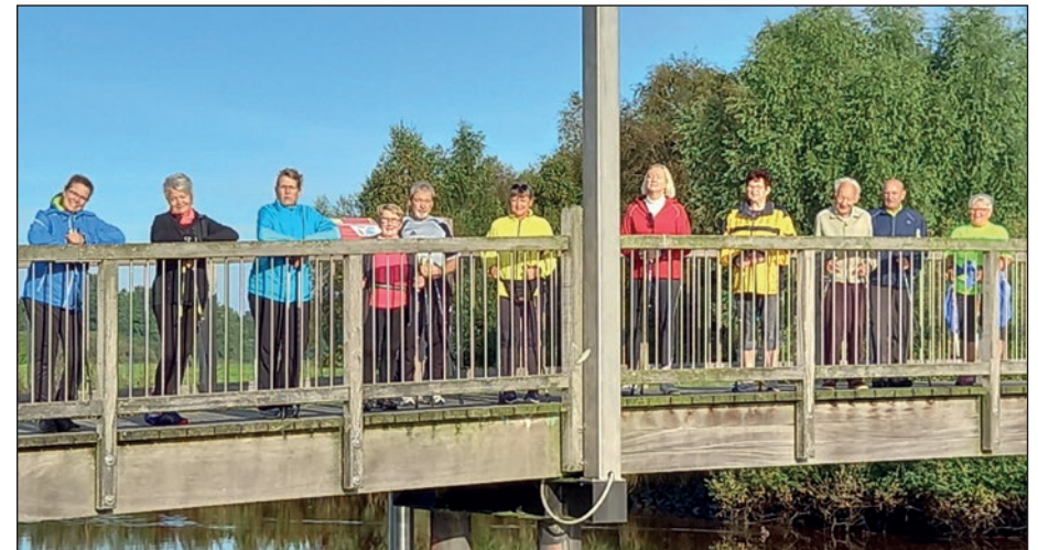
REHA-Sport hält fit bis ins hohe Alter.

Von April bis Oktober jeweils am ersten Mittwoch im Monat.